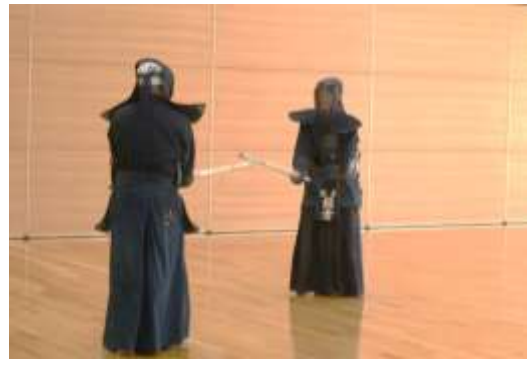
尾方先生・緒方先生の指導稽古