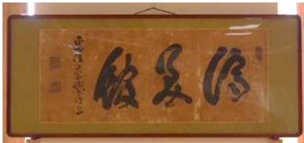
「劍聖」山岡 鉄舟著 (済美館)