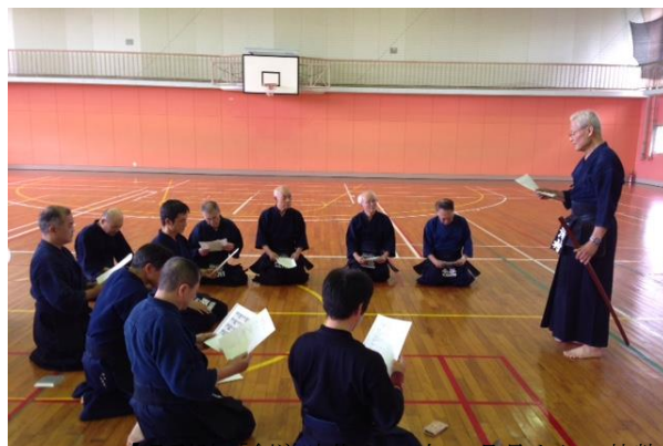
【月刊誌「剣道時代2018年8月号より」抜粋】