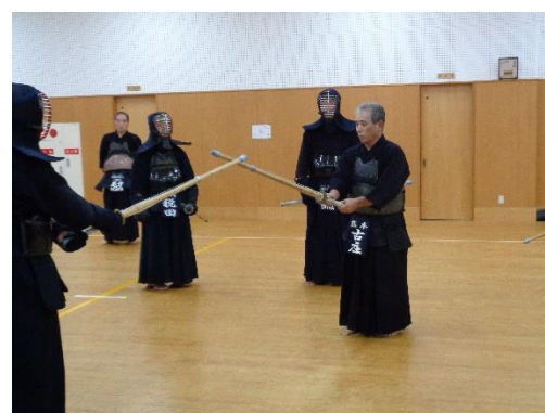
(古庄先生の基本指導風景)